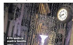
Il Dfe sposta in avanti le lancette. TRASSI