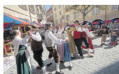
Finora il Ticino, con la sua etichetta di "Sonnenstube", era abituato a ragionare solo in ottica stagionale.