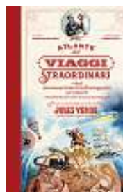
Atlante dei viaggi straordinari e degli inconsueti mezzi di trasporto per compierli , Edt-Giralangolo, 66 pagine, 19,50 €

A 150 anni dalla pubblicazione (1872), torna il capolavoro di Jules Verne in un'edizione, non integrale, con contenuti extra (immagini di orari ferroviari, locandine di spettacoli, pubblicità di giornali) creati dagli allievi del corso di Graphic Design - Motion Graphic dello IED di Roma attingendo a font e illustrazioni dell'epoca. L'Atlante dei viaggi straordinari conduce il lettore nei luoghi e negli scenari raccontati dallo scrittore. In volo sull'Africa con un pallone aerostatico, negli abissi dentro un sommergibile, nella savana a bordo di un elefante meccanico: la sua capacità visionaria permise a Verne di anticipare l'evoluzione della scienza e della tecnologia.