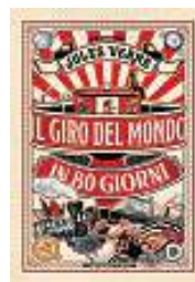
Jules Verne, Il giro del mondo in 80 giorni , Morellini editore, 192 pagine, 25 €